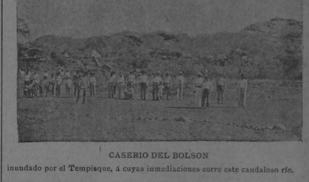
CASERIO DEL BOLSÓN inundado por el Tempisque, a 400 metros de altura que este caudaloso río.

Esta importante población, cabecera del cantón de Carrillo, situada entre los ríos Tempisque y Palmas, a orillas del primero, dista 40 kilómetros de La Berría. Tiene buenas calles, algunos edificios importantes, muchos establecimientos comerciales de bastante importancia, Iglesia, dos casas de escuela, oficinas para la Jefatura Política, Alcaldía, Telégrafo y Correo y está a unos tres metros sobre el nivel del Tempisque.