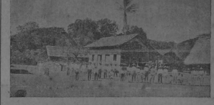
Y la que más ha debido sufrir con la inundación, por su poca diferencia de nivel con el lecho del río.